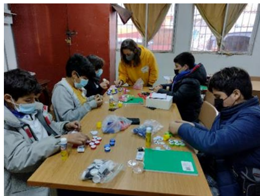
Armando nuestras fichas de Ajedrez