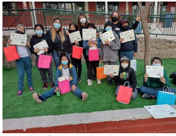
Finalización: Entrega de Diplomas y Regalo