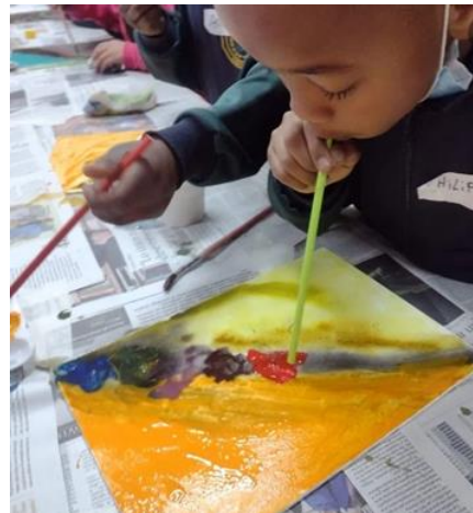
Técnicas de Pintura