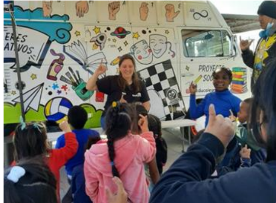
Aprendiendo el abecedario en Lengua de Señas