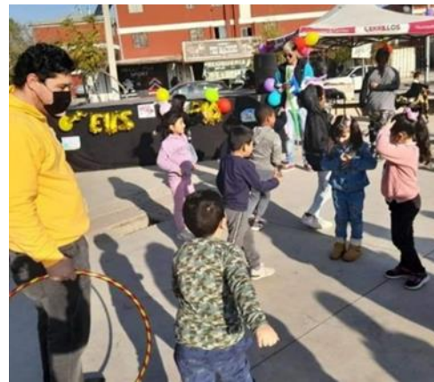
Actividades y Juegos