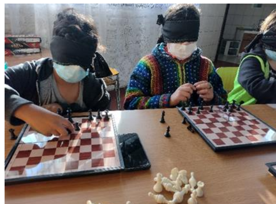
Ubicando las piezas a ojos cerrados