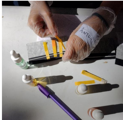
Midiendo pH con papel especial