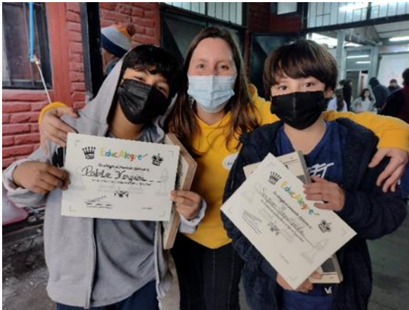
Entrega de Diplomas y Regalito