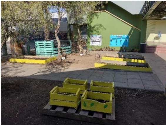
Patio de la escuela después de la intervención