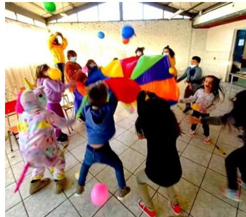
Juegos de Inicio