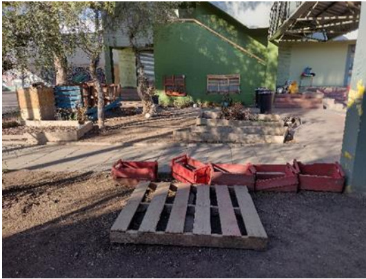
Patio de la escuela antes de la intervención