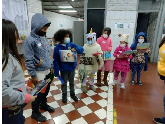
Eligiendo mi Libro de Regalo

Los Cuentos que se narraron en estas sesiones son los siguientes: