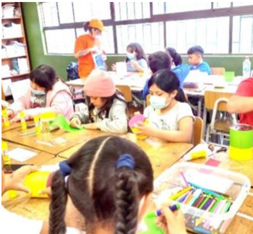
Haciendo un Tambor con material Reciclado