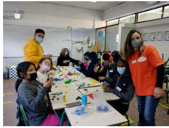
Armando nuestras fichas de ajedrez con tapitas