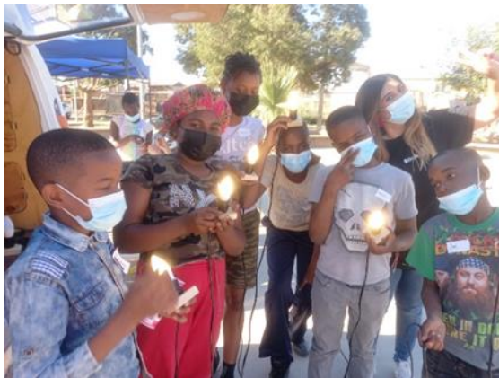
Actividad: Construyendo una lámpara