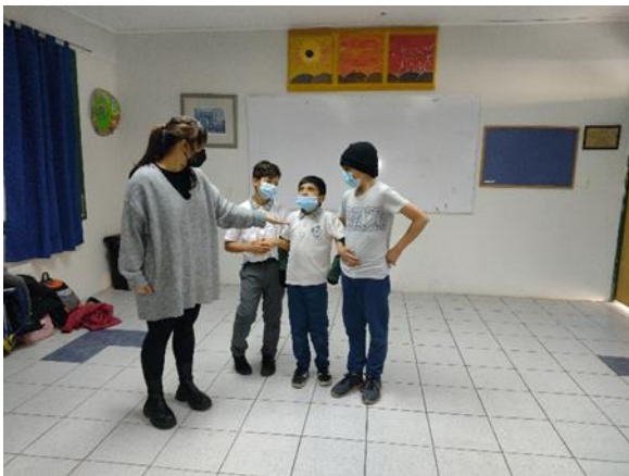
El monstruo de 3 cabezas