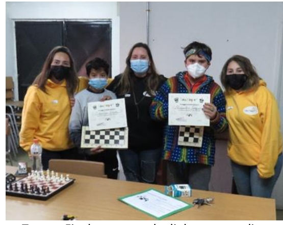
Torneo Final y entrega de diploma y regalito