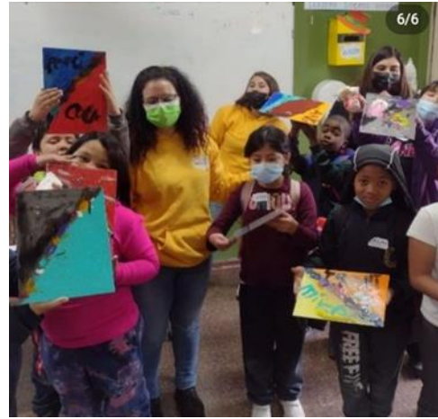
Terminadas las obras de Arte