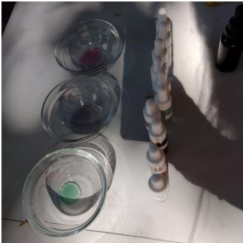
Midiendo pH método casero (con repollo morado)