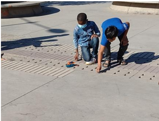
Carrera de autos solares ¿cuál gana el más grande o el más pequeño?, ¿por qué?