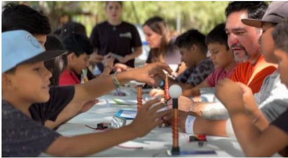
Trabajando en equipo