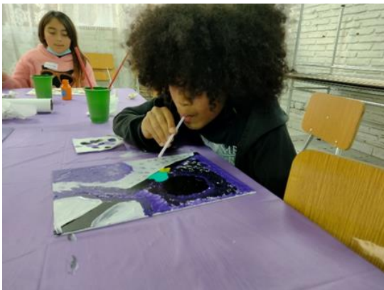
Pintando con Acrílico