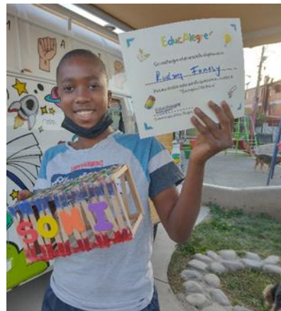
Entrega de diplomas por participar en el taller de Energía Eléctrica