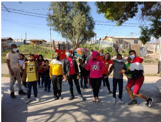
Actividad de Inicio - Taller Decoupage