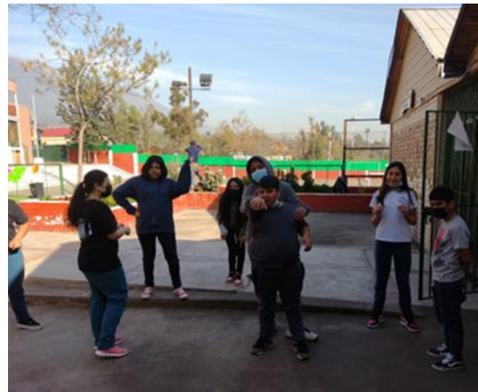
La Foto de lo que pasa en una Plaza