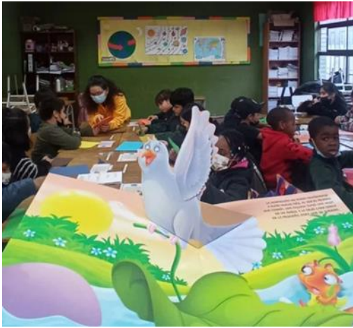
La Paloma y la Hormiga