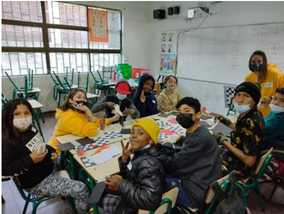
Armando nuestro Tablero Plegable