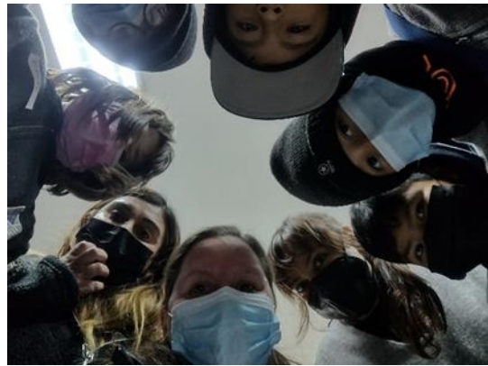
Improvisando una Foto