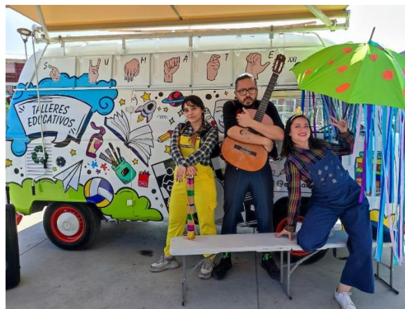
Compañía El Ojo Teatro