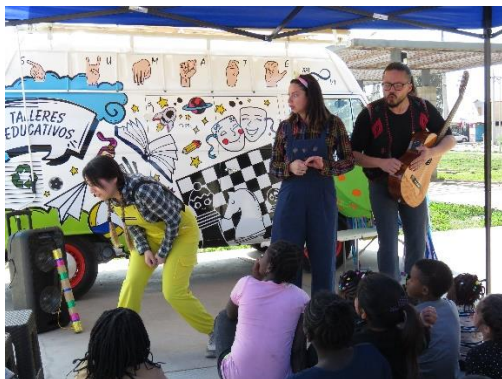
Galatea y mi Amiga Espacial