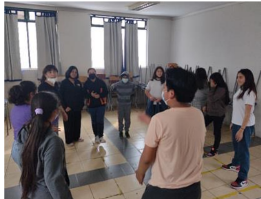
Armando historias en 3 segundos