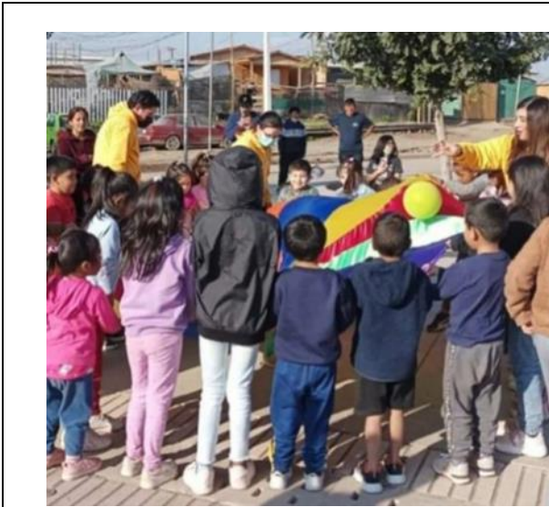
Jugando con el Paracaídas Trabajo en Equipo