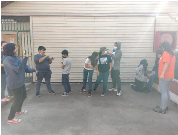
La Foto de un Local de comida Rápida