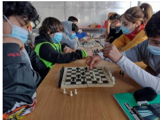
Juego la Guerra de Peones