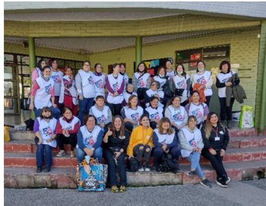
Voluntarios y equipo de Trabajo

Además de todo este aporte que hicieron, les llevaron colaciones y gorritos tejidos por ellas a todos los niños, niñas y jóvenes que participaron en los talleres.