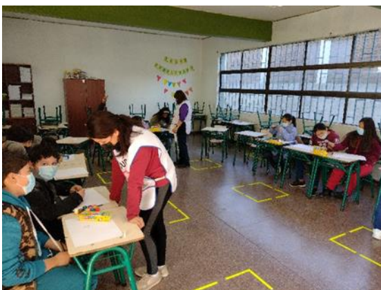
Arte y Pintura