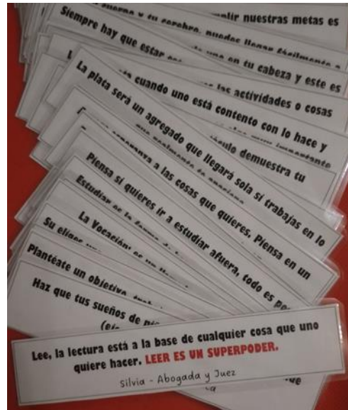
Marcadores de Libro con Frases y Consejos