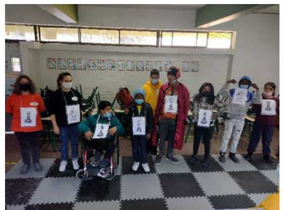
Moviendonos como Figuras de Ajedrez