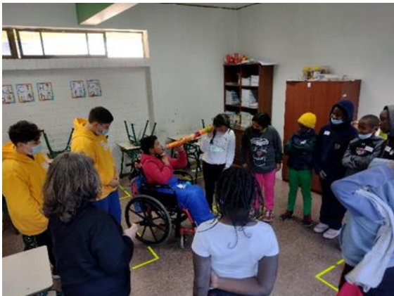
Actividad de Inicio Adivinanza con Susurrador