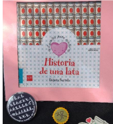
Cuento sobre el Reciclaje, chapita con abecedario en lengua de señas y tapa 3R.