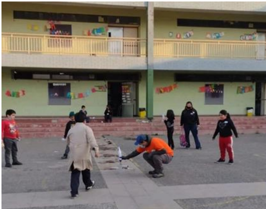
Despegando nuestro Cohete