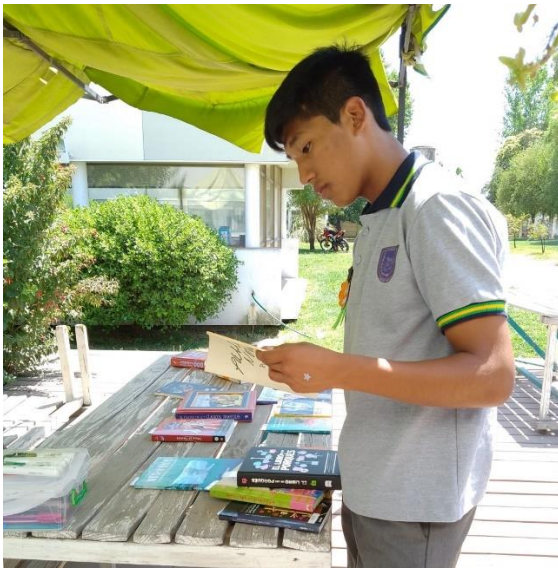
Escogiendo su libro de regalo