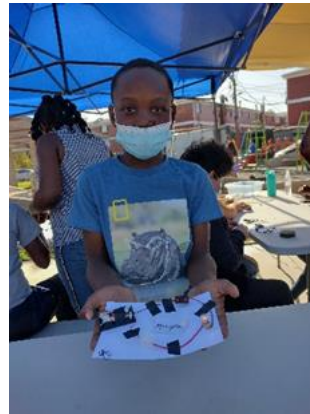
Actividad: Armandu un circuito eléctrico