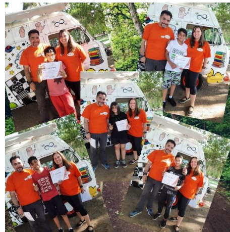
Finalización y entrega de Diplomas