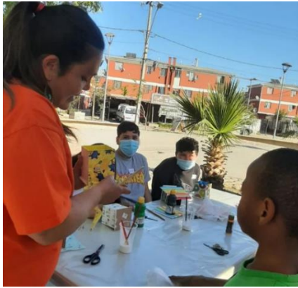
Aprendiendo la Técnica de Decoupage