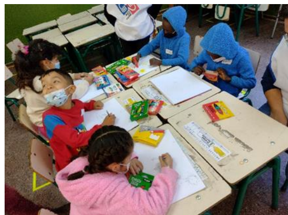
Actividad de Comprensión Lectora