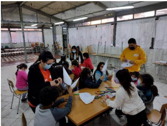
Armando un Cohete