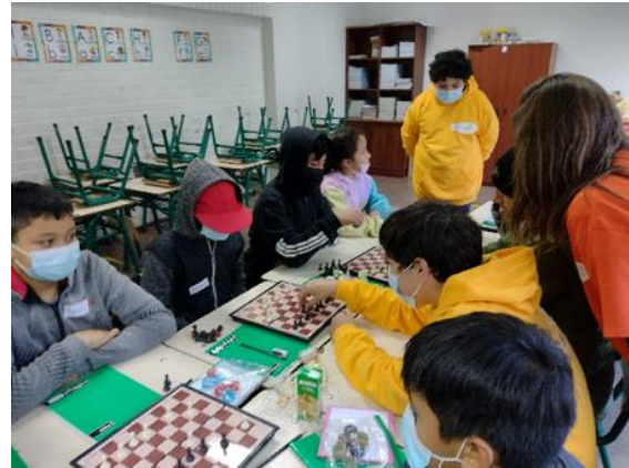
Guerra de Peones