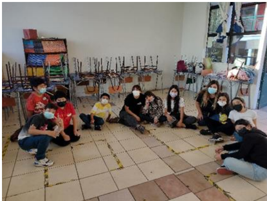
Sesión del Taller