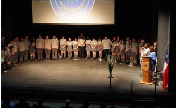
Graduación de 8vo Básico