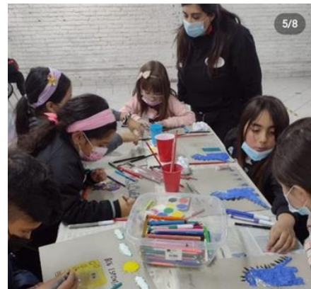
Nuestra Portada con papel Maché