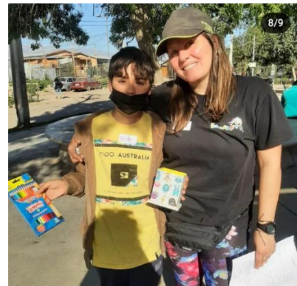
Entrega de lápices de colores