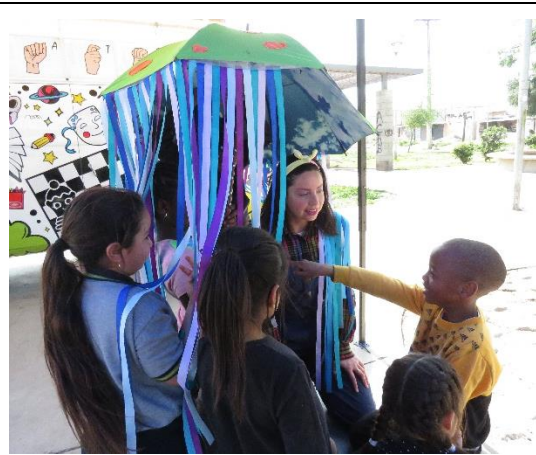
Pequeño Universo Portatil