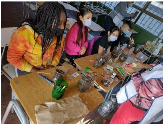
Huerta y Reciclaje