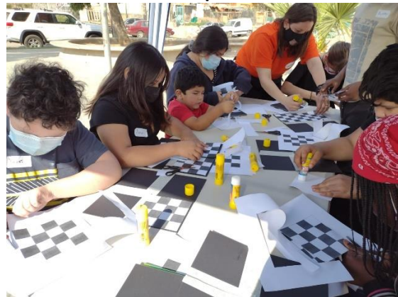
Armando nuestro Tablero