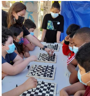
Jugando a la Guerra de Peones