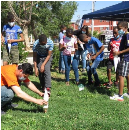
Actividad: Despegando un Cohete